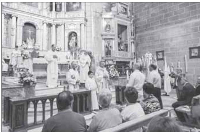
Celebración de la Eucaristía en la iglesia de Santiago