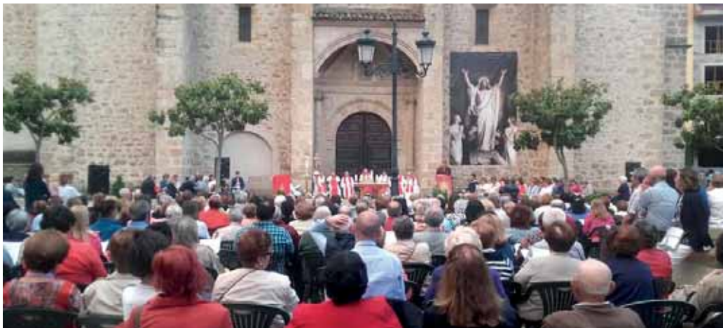
Vigilia en Navalmoral, 2018