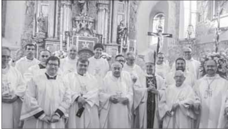
Celebración de la eucaristía presidida por nuestro obispo

El jueves 30 de mayo, día de su fiesta, a las once de la mañana la imagen de la patrona procesionó por el "pueblo de abajo" hasta la parroquia, acompañada por los danzantes, bailando en su honor. A continuación, Monseñor Retana Gozalo, presidió una solemne eucaristía, concelebrada por sacerdotes y vicarios de nuestra diócesis. La misa fue cantada por el coro parroquial. Al término de la mis-