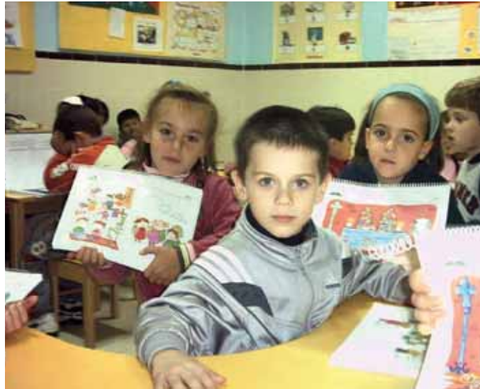
Niños enseñan dibujos realizados en clase de Religión

También parte de la campaña se dirige hacia los padres que toman esa decisión, vinculando el derecho que tienen para elegir el modelo de educación de sus hijos con la responsabilidad que ello implica. Por eso, desde la Comisión Episcopal de Enseñanza se invita a los padres a favorecer la educación religiosa de sus hijos, sin dejarse frenar por las dificultades que pueden encontrar a la