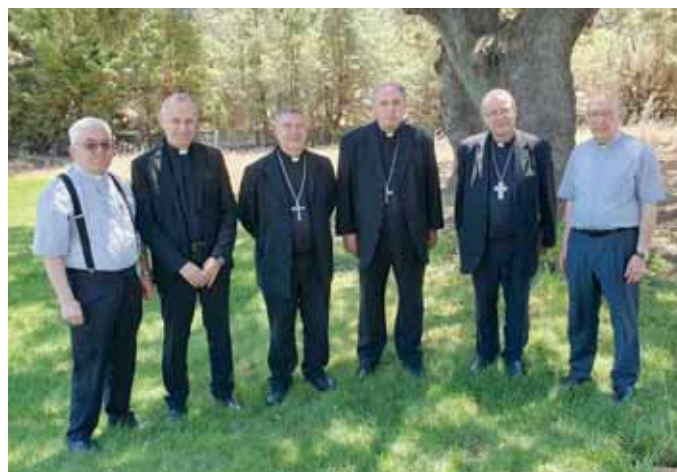
Obispos extremeños y sus vicarios generales tras la reunión

Revisaron también el encuentro conjunto que se celebró en Cáceres de Obispos, Vicarios y Arciprestes con motivo del XXV aniversario de la creación de la Provincia Eclesiástica; se ha valorado positivamente dicho encuentro como preparación de esta efemérides. Los obispos valoran la posibilidad de tener otros encuen-