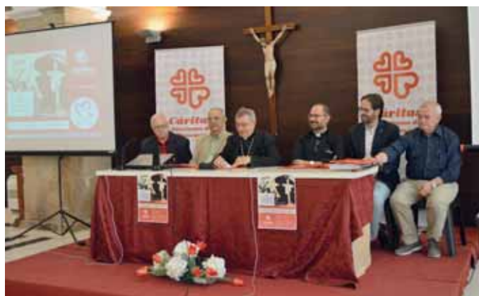
Más de un centenar de personas se dieron cita en Plasencia

Acto seguido los ponentes, participantes del Equipo Motor que llevan varios meses trabajando en la elaboración del Plan Estratégico, presentaron ante todos las conclusiones recogidas por Cáritas por toda la diócesis. Destacando temas como: Cómo funcionan nuestras Cáritas, Qué nos mueve, Qué labor se lleva a cabo princi-