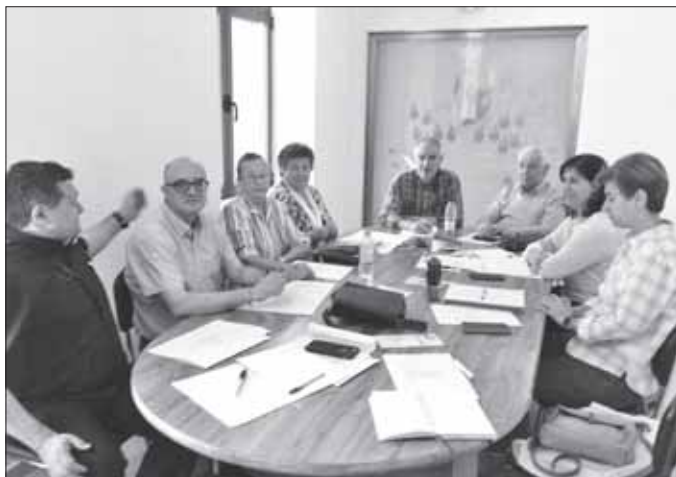
El Seminario de Cáceres acogió el encuentro

En el Seminario de Cáceres, el 29 de mayo, tuvo lugar una reunión interdiocesana de las Delegaciones de Misiones Extremeñas. El punto fuerte de la misma fue preparar la Jornada de oración, reflexión y testimonio misionero, en consonancia con el MME (Mes Misionero Extraordinario) que tendrá lugar en el Seminario de Cáceres el 5 de octubre. La organización de este encuentro corresponde a la delegación de Misiones de Plasencia y el tema de la ponencia será el lema del Domund “Bautizados y enviados, la Iglesia de Cristo en misión en el mundo” aplicado a la realidad de nuestras diócesis. Se está elabo-