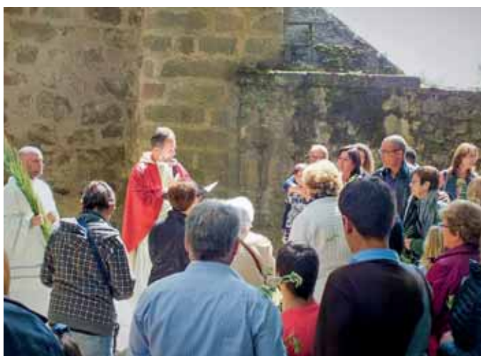
Celebrando el Domingo de Ramos en el monasterio de Yuste

—En este mundo tan alejado de Dios en el cual reinan los valo-