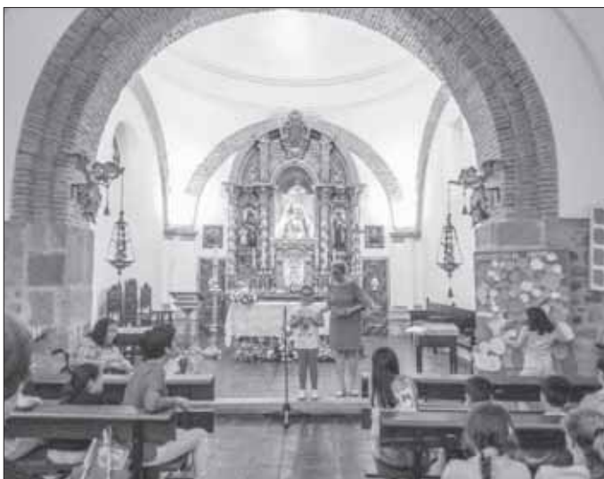
Acto Mariano de los niños de catequesis de Iniciación Cristiana