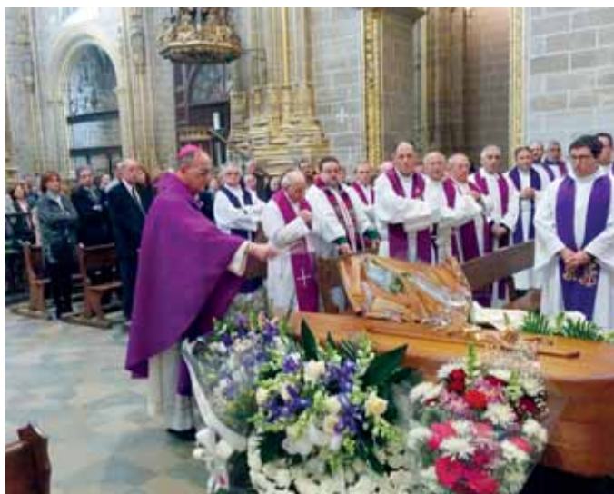
Exequias celebradas en la catedral de Plasencia

Durante sus primeros años de sacerdocio, antes y después de cursar estudios en Roma, fue coadjutor de Santa María en Jaraíz de la Vera y de San Esteban de Plasencia.