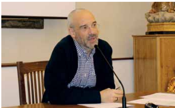
La conferencia fue en el Seminario Diocesano

Me atrevería a señalar algunos de los rasgos más relevantes como que tienen un reclamo más precoz para tener que elegir a la vez que ser adulto es más complejo que antaño, por lo que están especialmente preocupados por no acertar y anticipan más consecuencias negativas. Valoran muy especialmente a sus familias. Experimentan cierta desesperanza