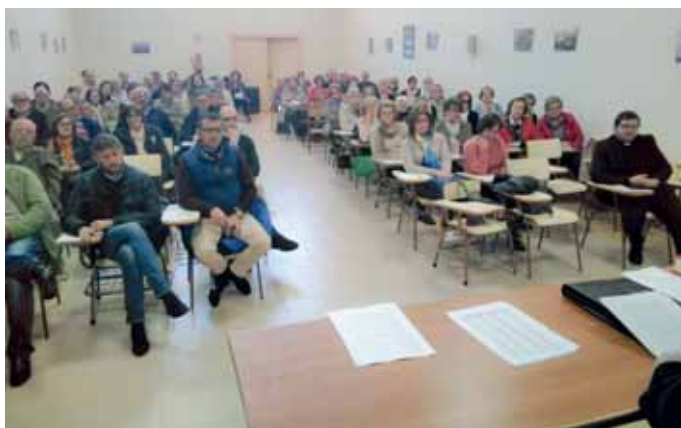
Curso celebrado en Miajadas para la zona sur de la Diócesis

Para la zona norte de la diócesis el 23 de febrero en el Seminario de Plasencia y para la zona sur, el nueve de marzo en la iglesia de Guadalupe de Miajadas, se impartió un curso de iniciación o actualización de "Ministros Extraordinarios de la Comunión". Gracias a este curso los asistentes reciben la facultad de administrarse a sí mismos y a los demás fieles de su comunidad parroquial, el pan eucarístico durante la Misa o fuera de la celebración eucarística en las circunstancias previstas por la autoridad eclesial. Retirar y purificar los vasos sagrados des-