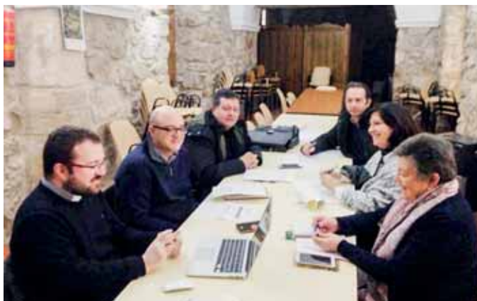
Reunión en Trujillo para preparar el encuentro

Las delegaciones de Misiones de la Provincia Eclesiástica de Extremadura están organizando un encuentro interdiocesano de niños con motivo del mes misionero extraordinario convocado por el Papa Francisco. El seis de abril la localidad diocesana de Trujillo acogerá este encuentro de Infancia y Misiones, dirigido a niños de ocho a doce años. La fecha límite de inscripción es el 29 de marzo. Cada parroquia o arciprestazgo organizará los autobuses y recorrido. Cada niño deberá aportar la autorización firmada por los padres o tutores.