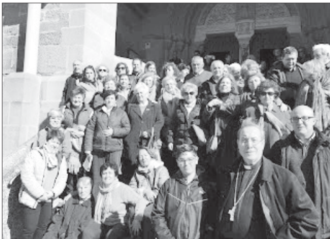
Participantes de las tres diócesis extremeñas

compartieron los productos aportados por cada uno, degustando la rica gama de alimentos provenientes de las tierras extremeñas. Así se concluyó una jornada de convivencia, celebración de la fe y preocupación por acompañar a los más débiles en la salud. ■