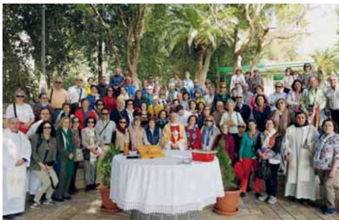
Celebración de la Eucaristía junto al lago Tiberiades