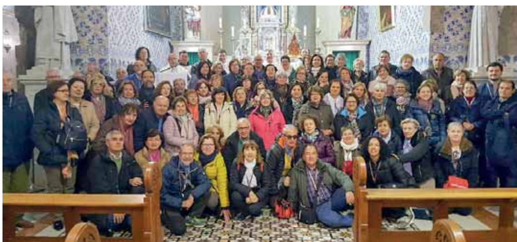
Iglesia franciscana de la Visitación, Aim Karim, Jerusalén