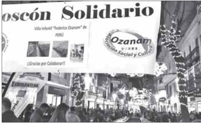
El pastel se colocó en la calle Ramón y Cajal

La sociedad San Vicente de Paúl, que gestiona el centro cultural