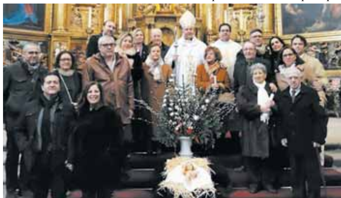
Celebración del Día de la Sagrada Familia