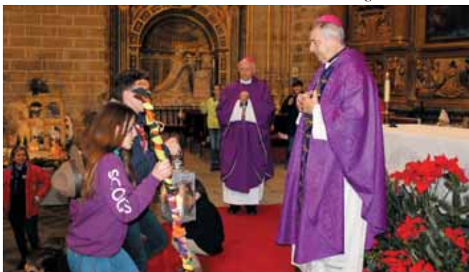
Bendición de las figuras del Belén y Luz de la Paz en la catedral