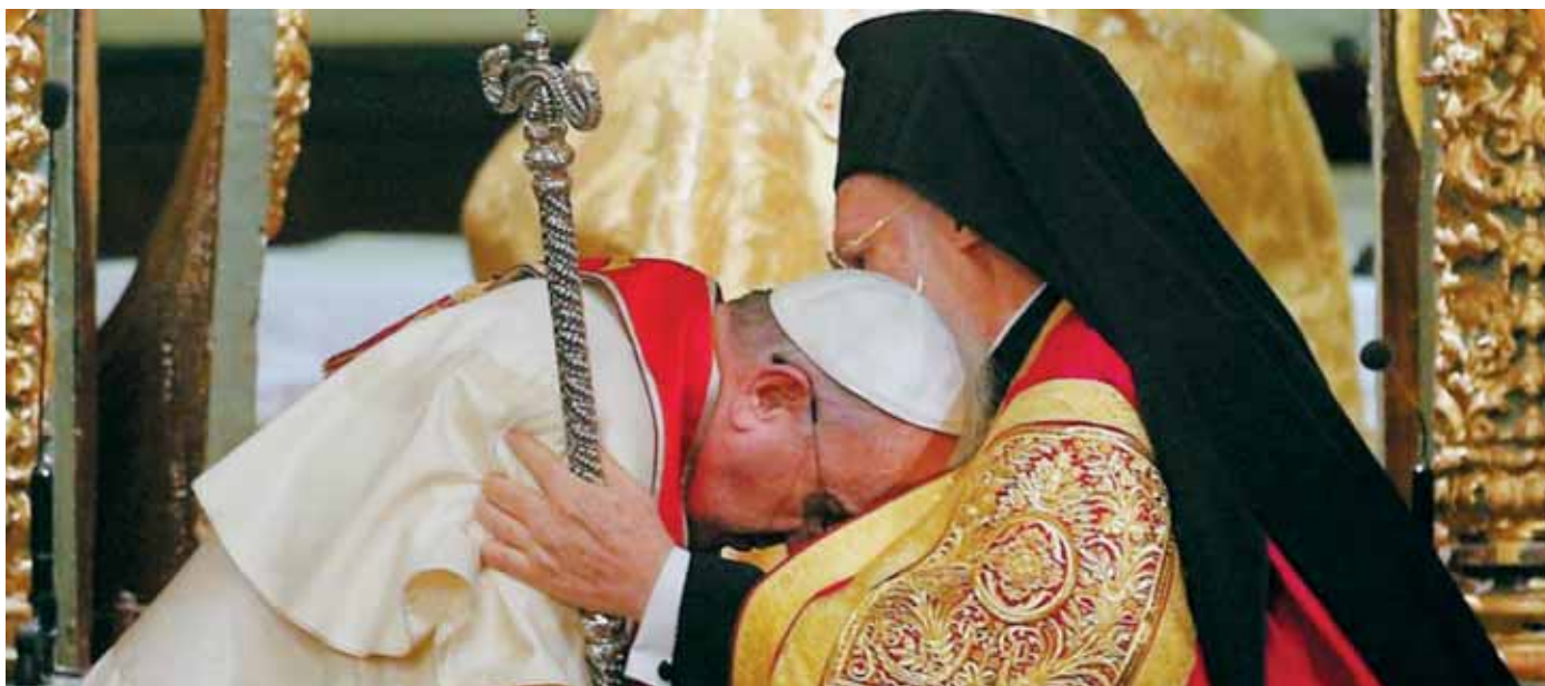
Encuentro ecuménico del Papa Francisco con el Patriarca Bartolomé de Constantinopla

es el lema para la Semana de Oración por la Unidad de los Cristianos 2019 que se celebra del 18 al 25 de enero