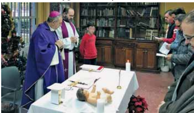
El 19 el prelado presidió misa en el CAT