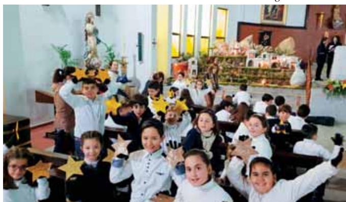
Sembradores de Estrellas en Navavillar de Pela