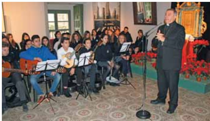
Felicitemos la Navidad a nuestro obispo en el Palacio Episcopal