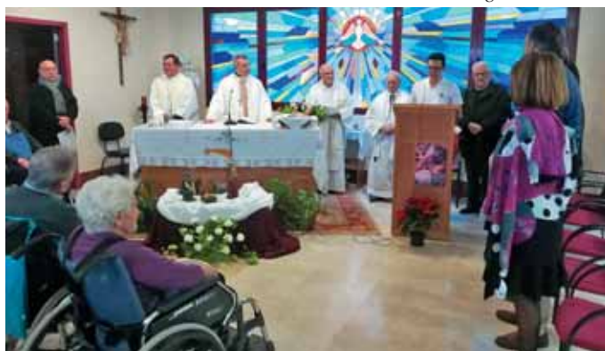
Misa del día 24 en el Hogar de Nazaret