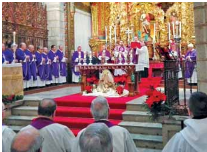
La catedral de Badajoz acogió la misa por D. Santiago

por el papa san Juan Pablo II, arzobispo de Mérida-Badajoz el 9 de julio de 2004, cargo que desem-