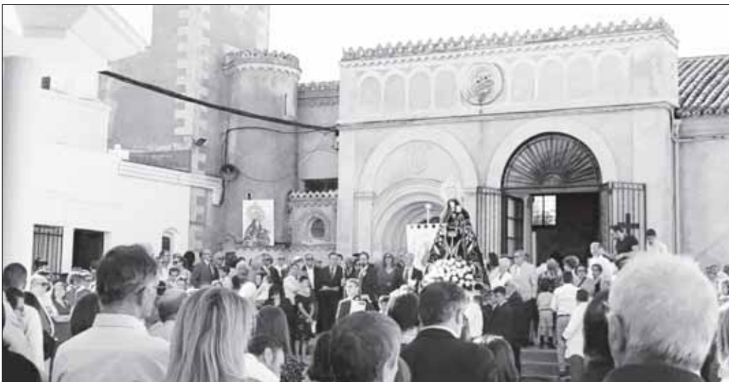
La imagen de la Virgen del Rosario saliendo en procesión

Hasta el 14 octubre Huertas de Ánimas celebra las fiestas en honor a la Virgen del Rosario, su patrona. Como es tradición se ha llevado a cabo la novena en honor a la Virgen y el rosario cantado por las calles el 5 de octubre. No faltó la celebración de la semana cultural junto a festejos taurinos y actuaciones musicales.