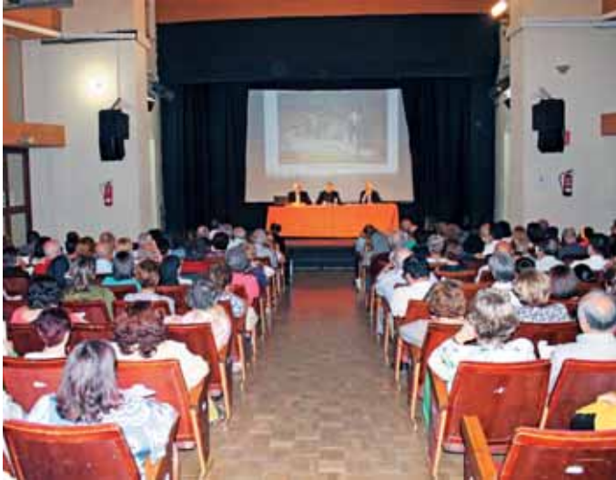
Conferencia en el teatro Gabriel y Galán