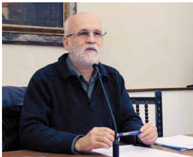
El Seminario diocesano acogió la conferencia

—Escribió Mario Benedetti que “todo es según el dolor con que se mira” y el Papa Francisco en su encíclica Laudato sí , define con precisión el sentido del análisis creyente de la realidad: “El objetivo no es recoger información