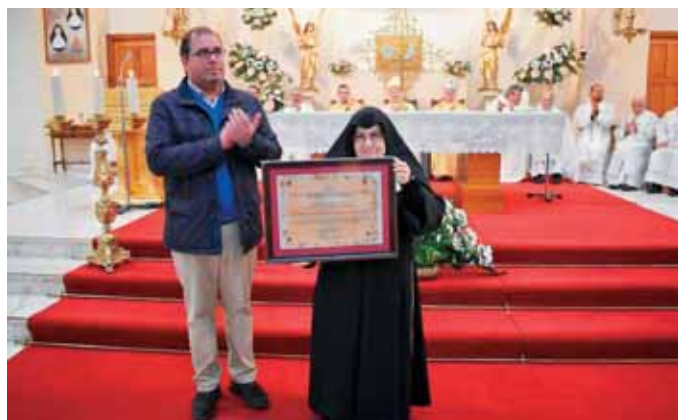
La madre provincial recogiendo el título de "hija adoptiva"