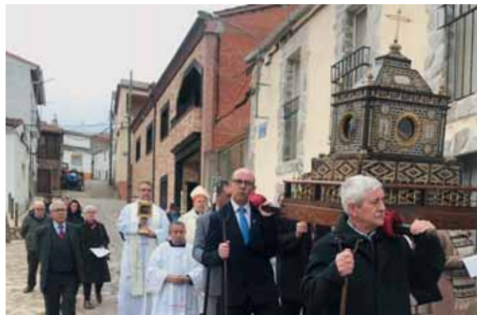
Procesión por las calles de Berzocana

Como es tradición, un año más, y con motivo de la festividad de San Fulgencio, patrono de la Diócesis, junto a su hermana Santa Florentina, y de la ciudad de Plasencia, el 16 de enero a las siete de la tarde, se celebró una solemne Eucaristía en la catedral de Plasencia. La misma fue presidida por primera vez por nuestro obispo, ya que el año pasado estaba enfermo en esta festividad, y concelebrada