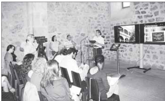
La presentación a los medios fue en la iglesia de San Martín

En la mañana del jueves 27 de septiembre la delegación de Patrimonio de la Diócesis de Plasencia presentó a los medios de comunicación, en la iglesia de San Martín, una nueva app de Turismo Religioso.