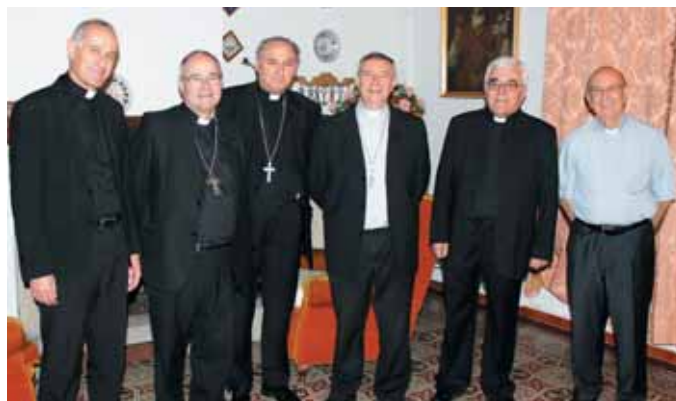
Arzobispo, obispos y vicarios en el Obispado de Plasencia

En ella, además de abordar la situación de la Iglesia en Extremadura, estudiando algunos asuntos importantes como la pastoral de los jóvenes y la familia, se trató principalmente la preparación del programa de celebración del XXV aniversario de la creación de la