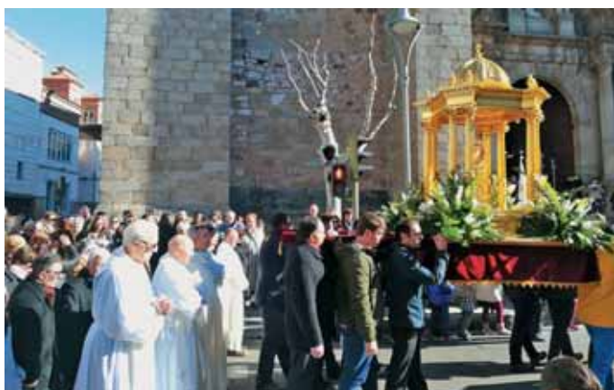
Procesión del Santísimo en reparación y desagravio