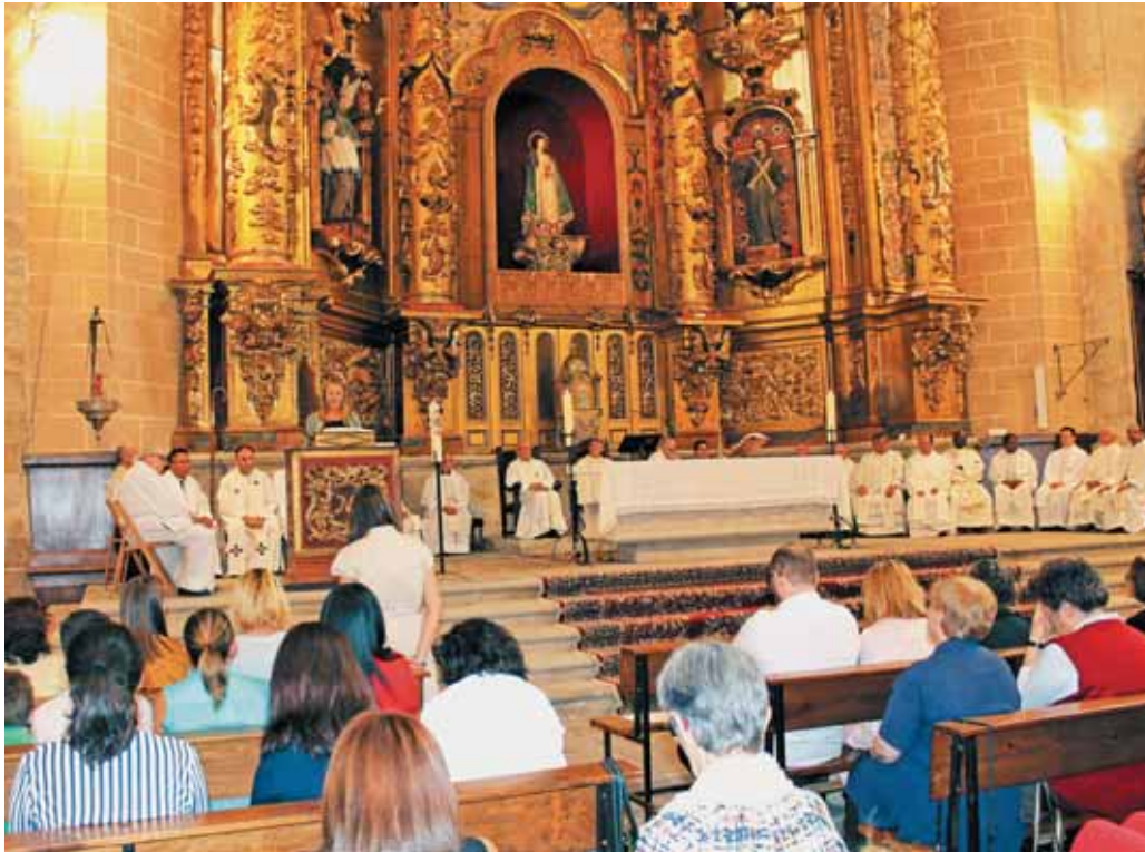
La iglesia de San Francisco acogió la celebración de la Eucaristía presidida por el Señor Obispo