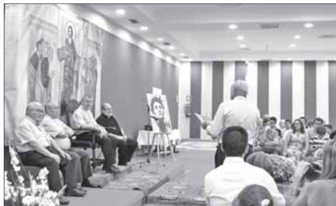
Exponiendo al obispo el itinerario de fe católica