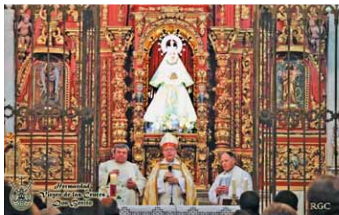
Acto Mariano en la ermita de la Virgen de las Cruces