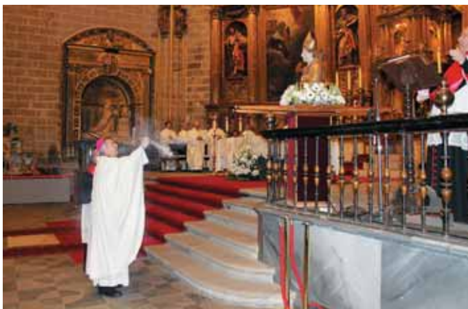
Celebración en la catedral de Plasencia